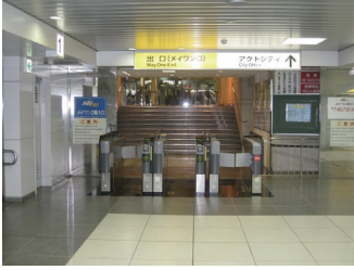
JR浜松駅2F メイワン口

*1 20:30時以降はJR浜松駅1Fの東海道線・東海道新幹線改札を出て、北口(右手)へお進みください。 北口を出て右手にお進みいただき、アクトシティ方面への階段をお上りください。