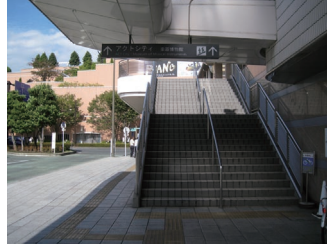
アクトシティ方面への階段(*1)