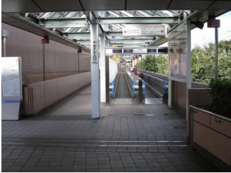
アクトシティ2F 動く歩道