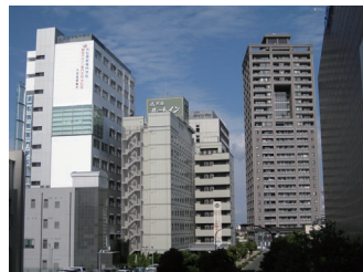
階段から見たHOTEL day by day(*2)